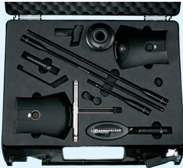
Installed Sound Base Kit XLR-3