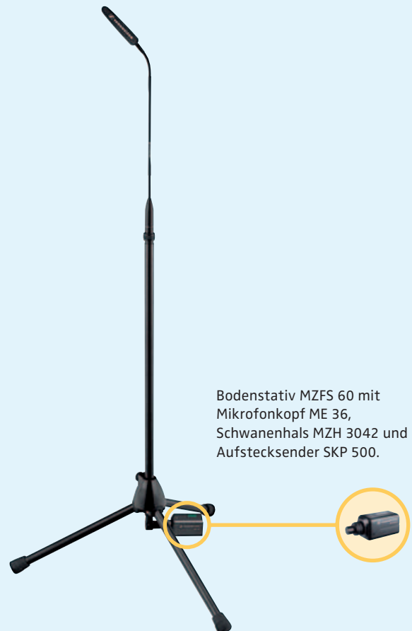
Bodenstativ MZFS 60 mit Mikrofonkopf ME 36, Schwannenhals MZH 3042 und Aufstecksender SKP 500.