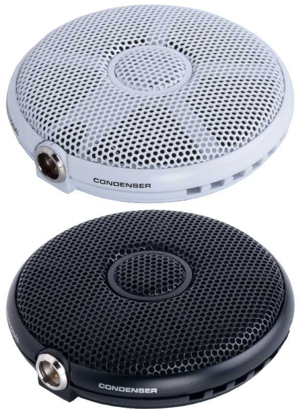
E304 Frequenzumfang (Kugel)