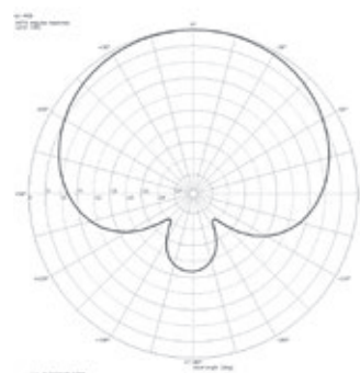
Polardiagramm @ 1 kHz