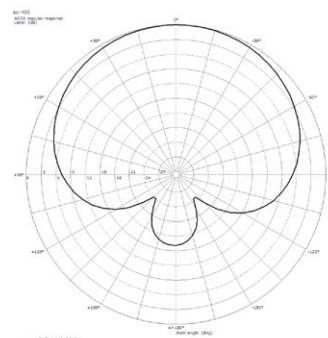
Polardiagramm @ 1 kHz