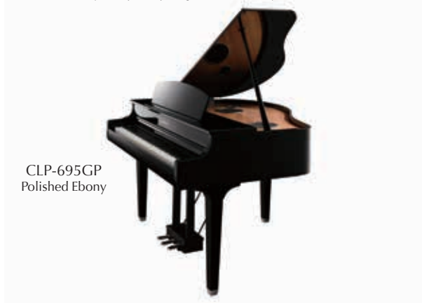
CLP-695GP Polished Ebony

Additional items (e.g. i-UX1, UD-WL01, Internet access) may be required to access certain functions. The descriptions and photos in this brochure are for information only. YAMAHA reserves the right to change the products and technical data at any time without notice. As the technical data may vary from country to country, please obtain information from your Yamaha dealer. No liability is accepted for printing errors. Status: January 2018