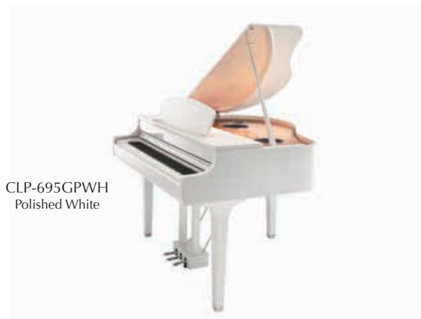
CLP-695GPWH Polished White