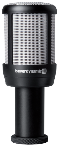
TG D50d mit Mikrofonklammer MKV 99