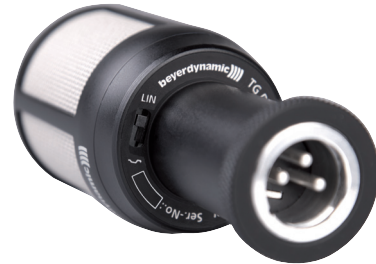
Umschalter LIN / EQ auf der Unterseite